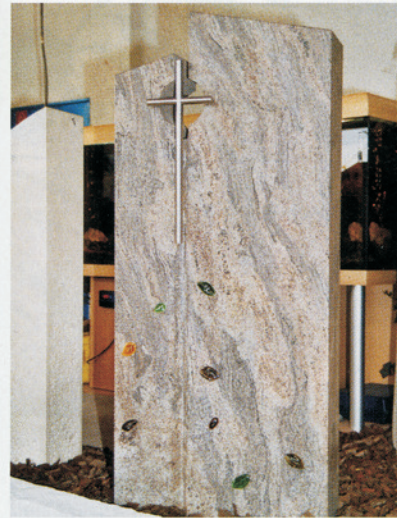
Grabmalgestaltung mit Blättern aus Glas und Edelstahlkreuz