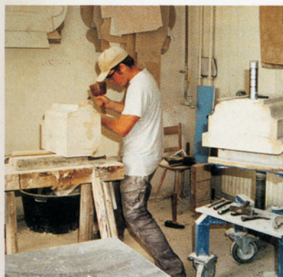
Lehrling bei der Arbeit